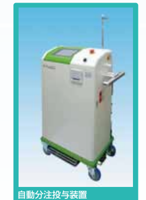
自動分注投与装置