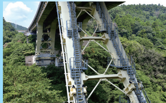
■田浦第二高架橋耐震補強工事【東日本高速道路株】