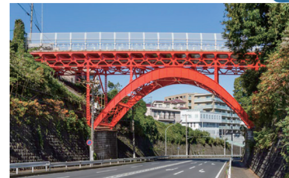
■打越橋補修工事【横浜市】