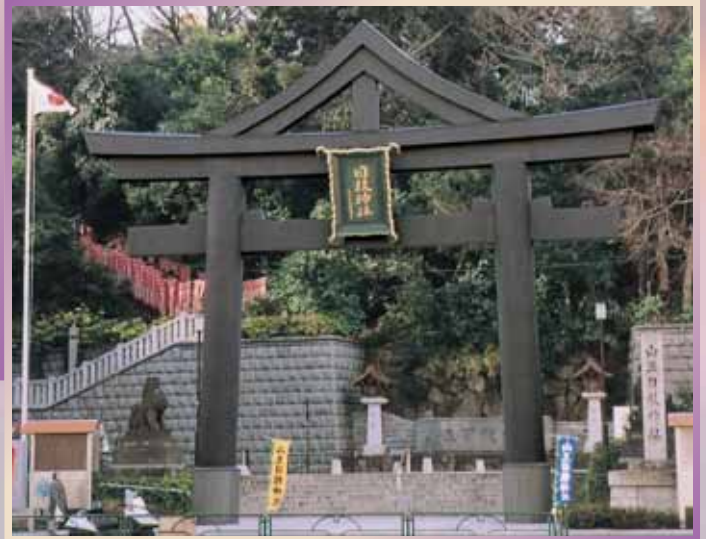
日枝神社 (一の鳥居)