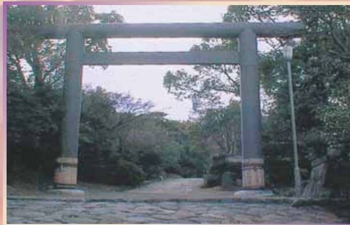
伊曾乃神社 (鳥居) 平成元年/愛媛県西条市 高さ 9.5m/幅 13.2m/柱径 0.87m/柱間隔 7.9m