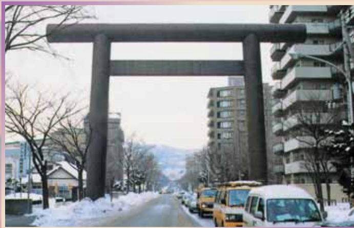
北海道大神宮 (大鳥居) 昭和43年/北海道札幌市 高さ 19.1m/幅 25.4m/柱径 1.9m/柱間隔 14.8m