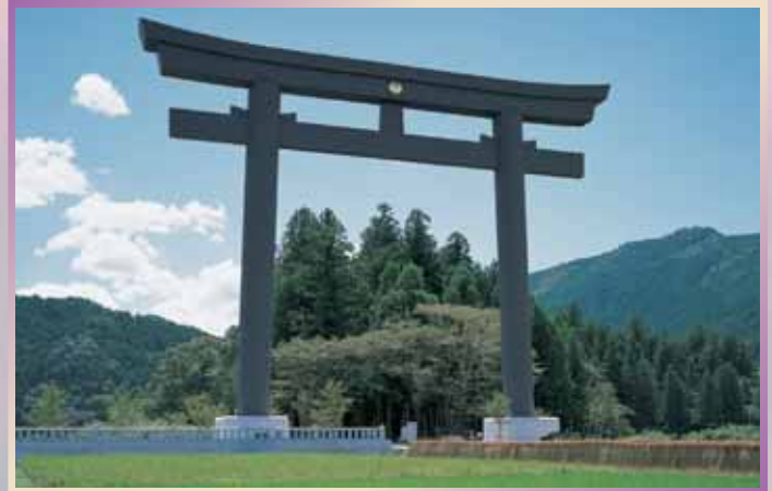
熊野本宮大社 (大鳥居)