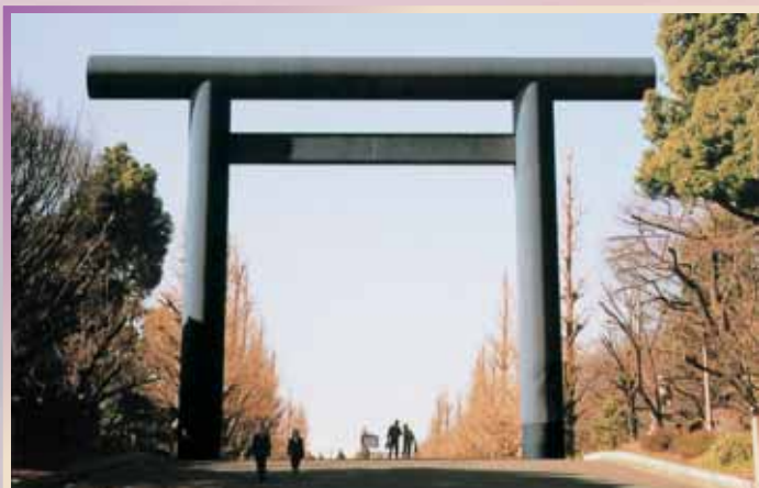
靖国神社 (大鳥居) 昭和49年/東京都千代田区 高さ 25.0m/幅 34.1m/柱径 2.5m/柱間隔 19.5m