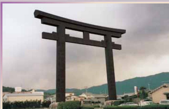
大神神社 (第一鳥居) 昭和61年/奈良県桜井市 高さ 32.2m/幅 40.8m/柱径 3.0m/柱間隔 23.5m