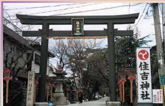
住吉神社 (鳥居) 平成8年/大阪府豊中市 高さ 5.76m/幅 8.01m/柱径 0.45m/柱間隔 4.5m