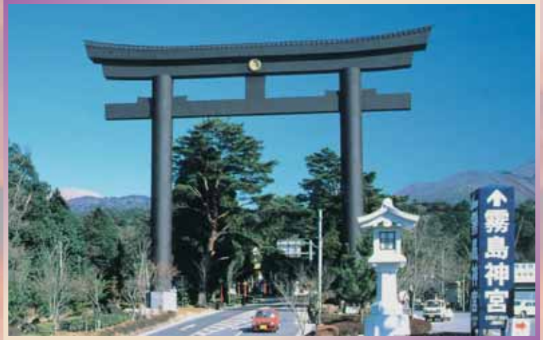
霧島神宮 (外参道大鳥居)