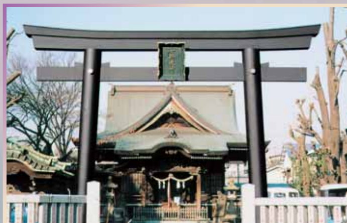
女躰神社 (鳥居) 平成9年/神奈川県川崎市 高さ 6.7m/幅 8.5m/柱径 0.5m/柱間隔 5.0m