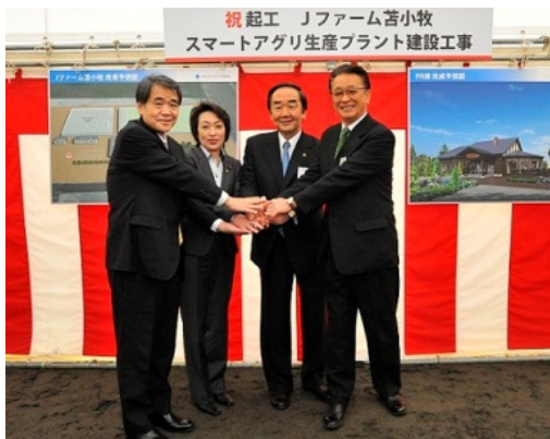
▲式典に出席した岩倉博文苫小牧市長(中央右) 橋本聖子参議院議員(中央左)、 JFEエンジニアリング 岸本純幸代表取締役社長(右) 同社 狩野久宣代表取締役副社長(左)