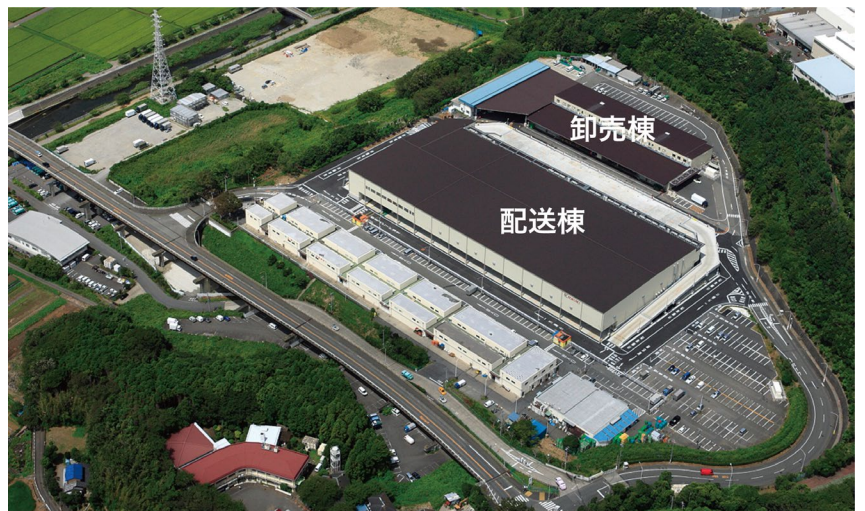
写真 (リニューアル後)