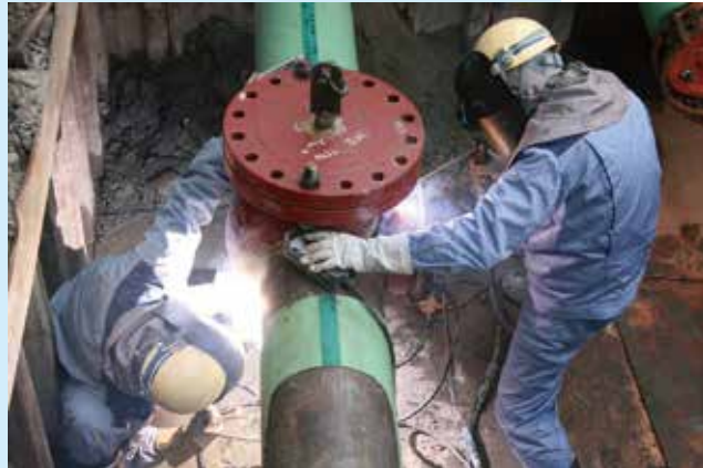
継手溶接(活管状態)