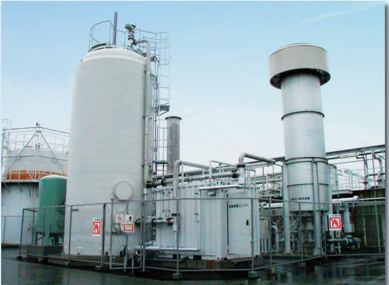
■ K社（ビール工場）生物脱硫塔設備

JFEは、バイオガス中の硫化水素の除去システムとして、従来の乾式脱硫装置のように廃棄物が発生せず、極めて低コストで、維持管理性の良い生物脱硫装置を提案しています。